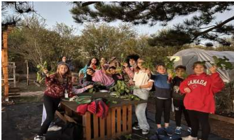
Equipe du club jardin le 06/11/2023